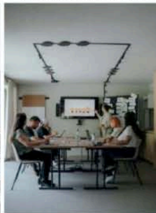
AMA Stay San Vigilio di Marebbe (BZ) T +39 0474 431480 www.ama-stay.com/it info@ama-stay.com